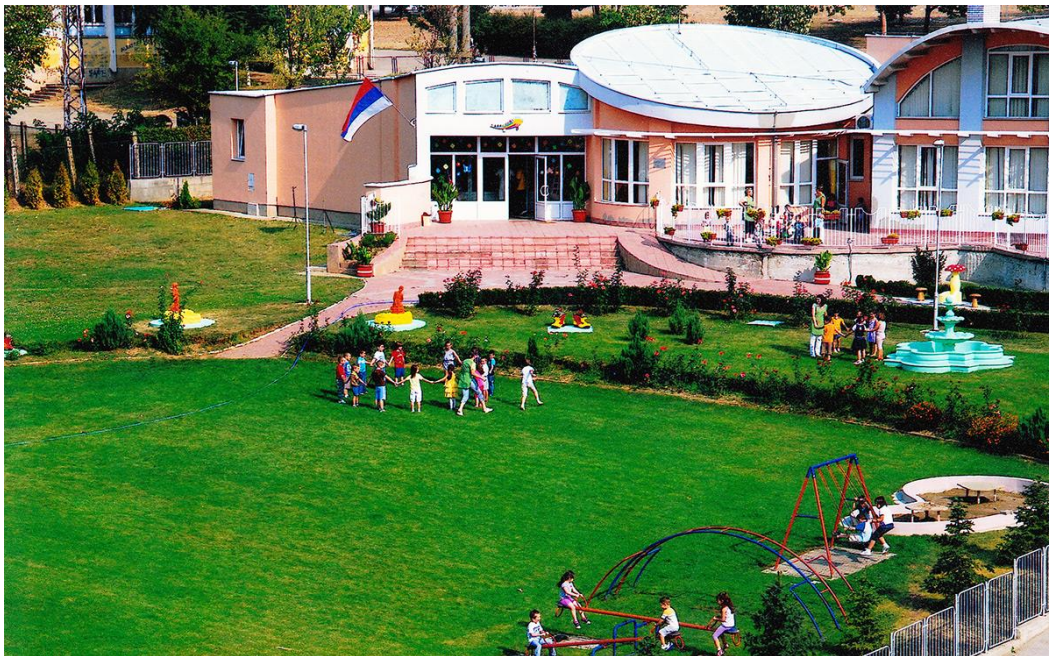
Слика 7: Објекат „Чаролија“

15. фебруара 2008. године у саставу Предшколске установе „Сунце“ у Куршумлији почиње са радом и објекат „Чаролија“. Површина објекта “Чаролија” износи 811 м 2 , а површина дворишног простора износи 4393 м 2 .