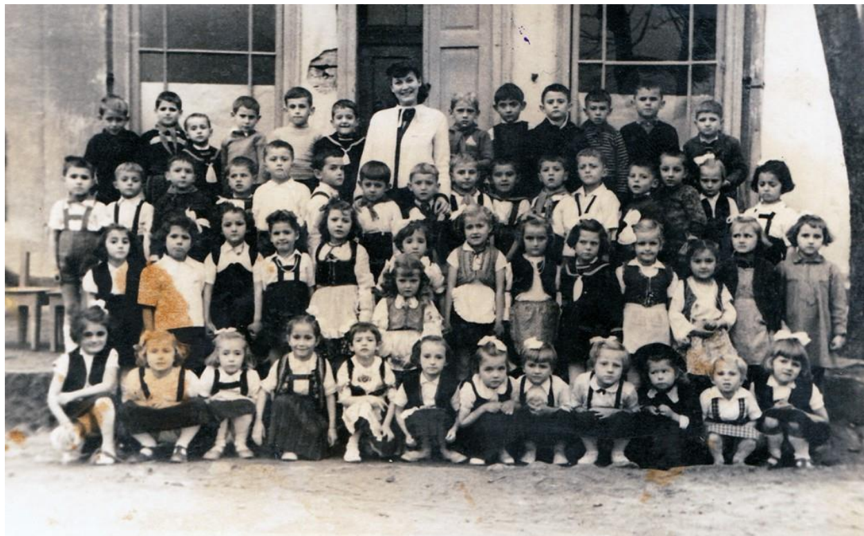
Слика 4 и 5: Прво забавиште на територији општине Куриумлија