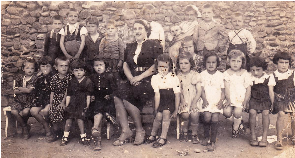
Слика 3: Први васпитач на територији општине Куршумлија

Забавиште је отворено при државној основној школи у Куршумлији, а на иницијативу “Кола српских сестара”. Била је оформљена једна група са преко 30 деце. Забавиште је радило континуирано до 1940. године да би у току другог светског рата прекинуло са радом. Поново је отворено 1944 / 1945. године.